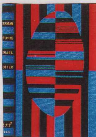
Cartonaje decorado inspirado en obras de H. Melville.

Con estos libros de tapa de cartón revestidos en tela y decorados por importantes encuadernadores se busca acercar el libro adornado al gran público, a un precio accesible.